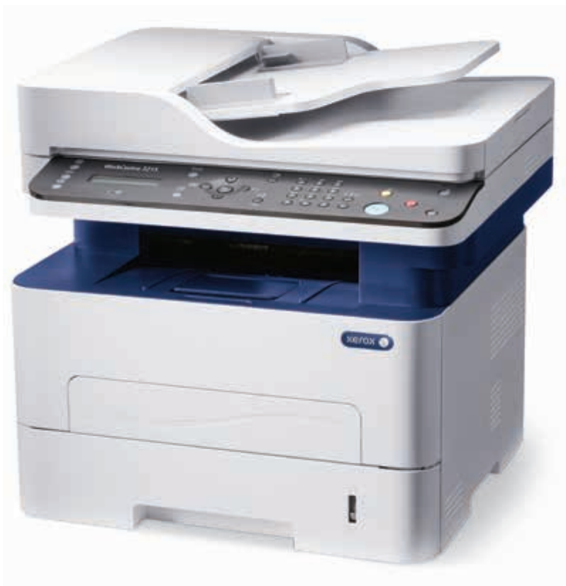
WorkCentre 3215. Копиране. Печат. Сканиране. Факс. Електронна поща.