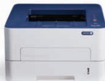
Phaser 3052. Печат.